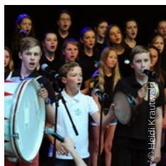
Kinder- und Jugendchöre

Gemeinsam präsentieren alle sieben Chöre des bekannten Kinder- und Jugendchores an der Oper Kiel ihre Lieblingssongs.